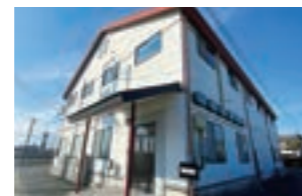
静岡県浜松市南区飯田町1567-1(本社) 静岡県袋井市久能1887

2015年に静岡県浜松市を拠点に設立された、青果卸機能も持つコンサルティング会社。「誰でも稼げる農家」になれるFC式経営モデルである「Happy Quality」を確立し、個人農家などに提供している。また、農業AIを用いた製品開発にも取り組んでいる。